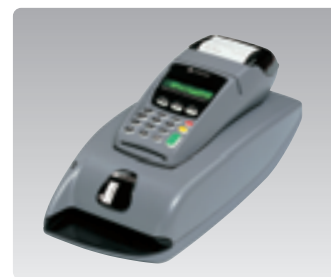
Elite 230, Elite 730