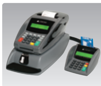
Elite 210, Elite 510