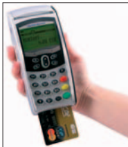
Carte à puce