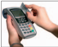
Carte à piste