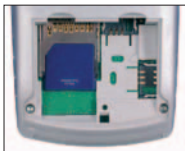
Carte mémoire SD